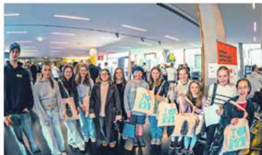
Die Teilnehmerinnen und Teilnehmer der Offenen Jugendarbeit Klostertal waren bei der Berufsmesse zu Besuch.

Berufswelt entdecken Die Jugendlichen trafen in der Dornbirner Firmenlandschaft ein und konnten dabei unterschiedliche Berufswelt kennenlernen. Besonders im Bereich der IT und der Sozialberufe. Doch auch in anderen Bereichen wie dem Gesundheitswesen und der Wirtschaftlichen Bereiche. Die Jugendlichen zeigten ein großes Interesse bei den verschiedenen Berufen und Berufen.