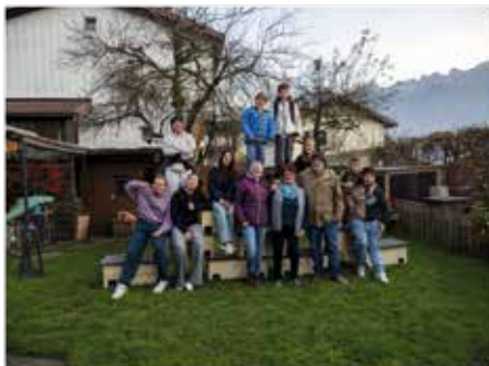
Gemeinsam wurde die Igelbehauungen gebaut und an die zukünftigen Bewohner geliefert. OJA

18.11.2024 • 14:14 Uhr / 3 Minuten Leszeit