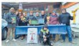
Bei der Aktion haben sich 19 Jugendliche der Offenen Jugendarbeit Klostertal beteiligt.